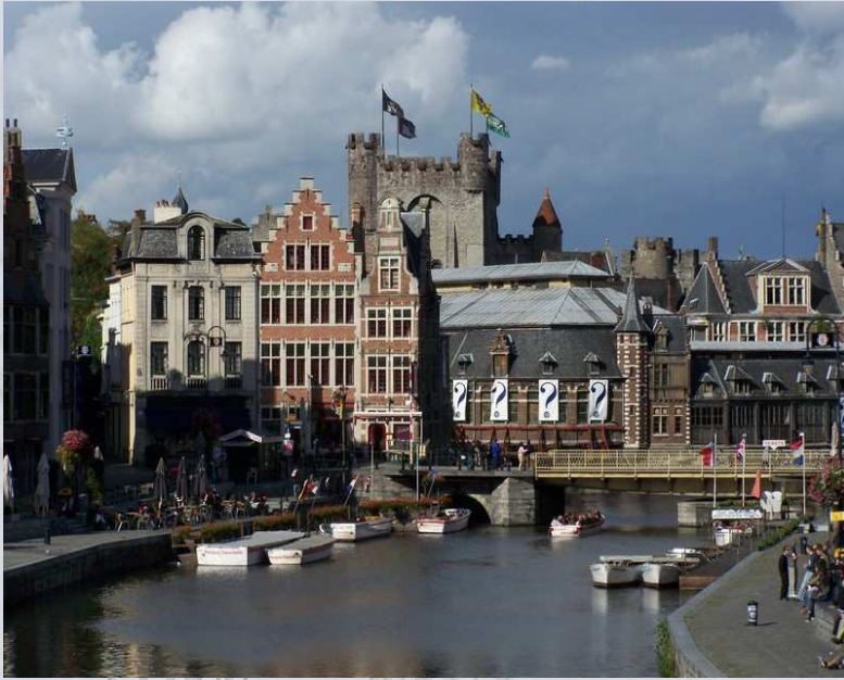
Blick vom alten Hafen auf die Burg 'Grafenstein'

ORT DER SUMMER SCHOOL: Die Summer School wird in der mittelalterlichen Stadt Gent, Belgien, abgehalten. Gent war um 1500 die zweitgrösste Stadt der Welt, als der Habsburger Kaiser Karl V. hier geboren wurde. Das Stadtzentrum wird geprägt durch seinen mittelalterlichen Charakter. Die Universität Gent wurde 1817 gegründet und ist heute eine der grössten Universitäten Belgiens mit mehr als 30.000 Studenten in 11 Fakultäten, von denen etwa 3.000 Wirtschaftswissenschaften studieren. Die Universität landet bei internationalen Rankings regelmässig unter den besten 100 Universitäten der Welt.