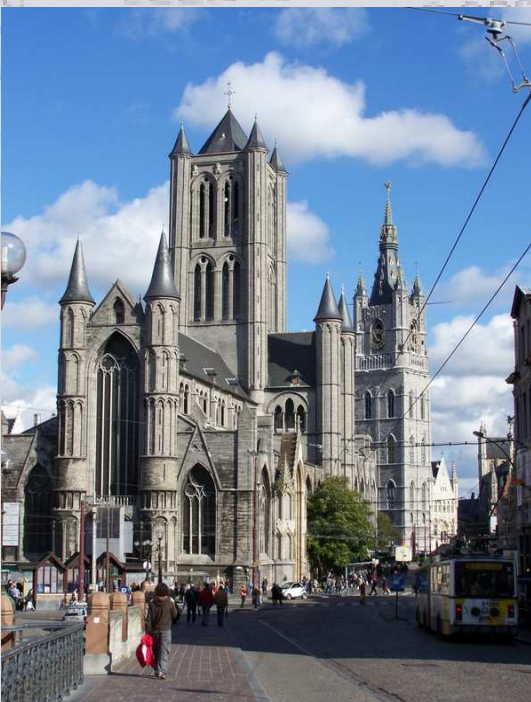
Die Kirche Sankt Nikolaus und der Belfried