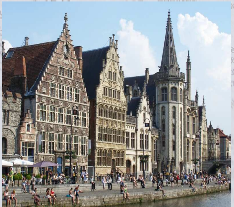
Historische Gebäude am Wasser