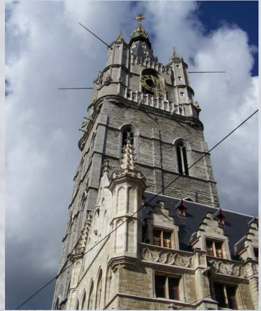
Der Glockenturm von Gent ('Belfried')