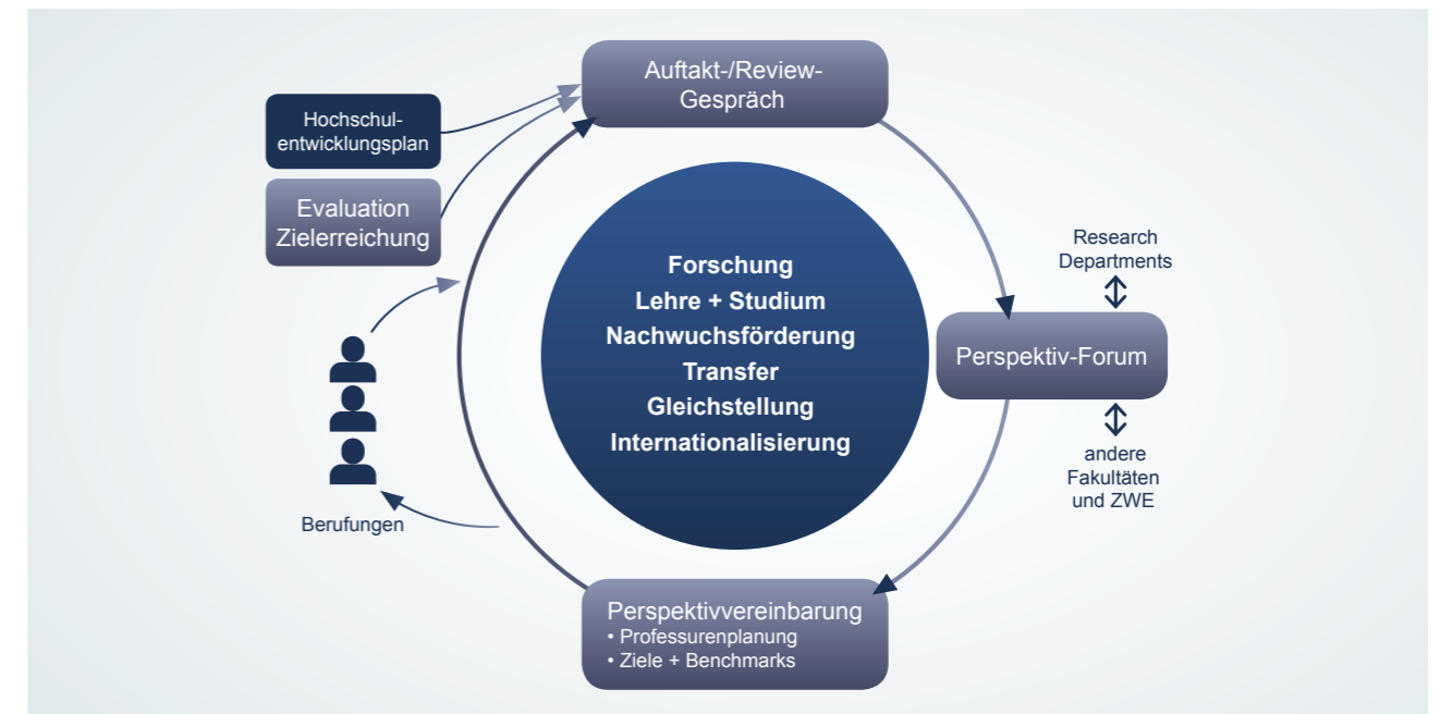
Abb. 2: Perspektivplanungsverfahren mit Fakultäten und ZWE

Die Governance- und Managementstrukturen der RUB bauen auf den Leitprinzipien Dialogorientierung, Transparenz und Teilhabe auf und gestalten Top-Down- und Bottom-up-Prozesse in ihrer adäquaten Verknüpfung. Ein Set von ineinandergreifenden formellen wie informellen Verfahren und Instrumenten soll einerseits Orientierung und Planungssicherheit bieten, andererseits Fortschritt und Neuausrichtungen ermöglichen. Zu den formellen Planungs- und Steuerungsformaten gehören der übergreifende Hochschulentwicklungsplan, der Perspektivplanungsprozess mit den Fakultäten und Zentralen Wissenschaftlichen Einrichtungen, die Zielvereinbarungen mit RDs sowie mit allen Einheiten der RUB in Bezug auf die Gleichstellung. Ein integriertes Managementinformationssystem, das auf Leistungsindikatoren basiert, die mit internen und nationalen Kriterien und Benchmarks verknüpft sind, unterstützt sowohl das Rektorat als auch das Fakultätsmanagement beim Monitoring der Prozesse. Für die Laufzeit dieses HEP liegt der Fokus sowohl auf der Überprüfung und Weiterentwicklung bestehender Strukturen und Instrumente als auch auf deren Ergänzung.