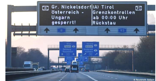
Grenzkontrollen wegen Corona, Europa im Mai 2020 (Deutsche Welle, 4. Mai 2020)