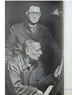
Brecht und Dessau