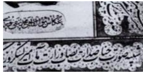
Abb. Ministerpräsident Amirkabir (gest.1852), Original im Golestanpalast, Teheran: www.jahanvatani.ir

Die Workshopreihe Eine etwas andere Archäologie des Wissens thematisiert interkulturelle Themenfelder und interdisziplinäre Fragestellungen. Online-Workshop: 11.2.2021; 18-20 Uhr . Anmeldung für Lektürematerial & Link: andere.archaeologie.wissen@gmail.com