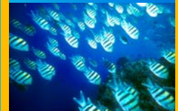
Fischökologie und Artbildung