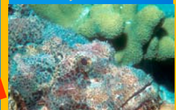
Giftige Organismen im Riff