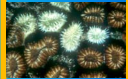
Anthropogene Einflüsse und Krankheiten