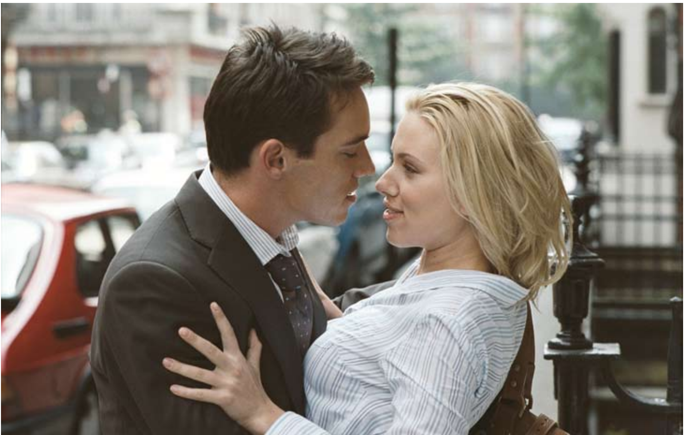
Abb.1: Narzissmus in der Partnerschaft: in den Medien vielfach vorgelebt. Hier Jonathan Rhyes Meyers und Scarlet Johansson in dem Kinofilm Match Point.

In Gesellschaft sind sie gern gesehene Gäste. Denn betreten sie das öffentliche Parkett, ist ein gelungener Abend meist gesichert. Schwungvoll spielen Narzissten ihre Stärken aus: sie sind unterhaltend, witzig, sparen auch nicht mit Komplimenten. Ihr perfekter Auftritt überzeugt – nicht selten gerade die Frauen. Dabei könnte, was die charmante Bekanntschaft verspricht, als späterer Partner kaum halten.