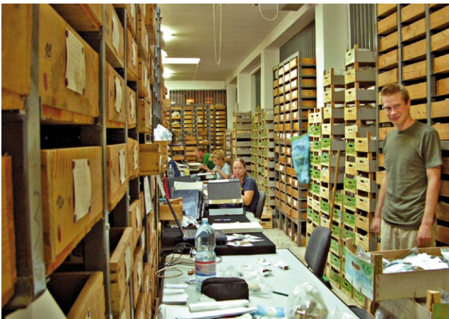
Abb. 2: Typische Archäologentätigkeit: Stöbern in Archiven rund um die Welt.