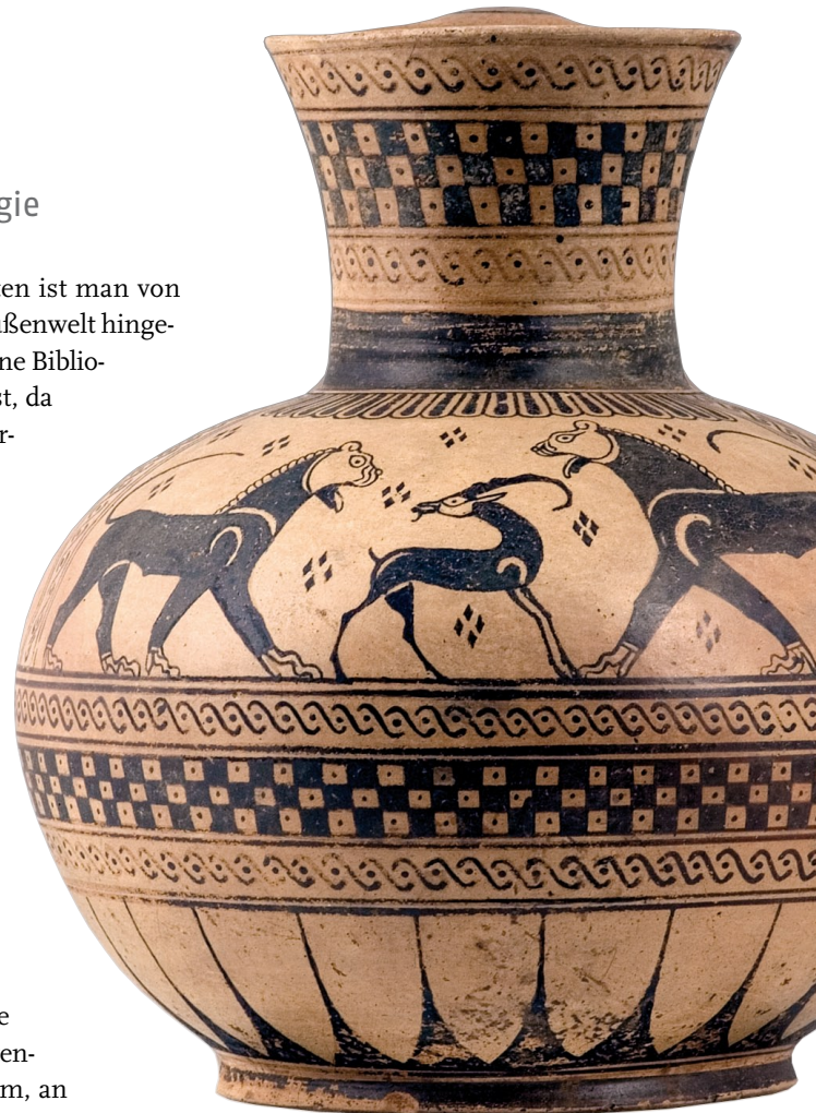
Abb. 1: Ein besonders schönes Fundstück der Kunstsammlungen der Ruhr-Universität. Künftig soll es nicht mehr nur hier vor Ort, sondern auch online zu bewundern sein.

Damit ArcheoInf über eine benutzerfreundliche, einheitliche Oberfläche Zugriff auf verschiedene archäologische Datenbanken gewähren und die gefundenen Informationen zugleich mit geographischen und bibliographischen Daten verknüpfen kann, muss ein Dolmetscher dazwischen geschaltet werden. Herzstück ist der so genannte Mediator. Diese Software macht es möglich, zeitgleich unterschied-