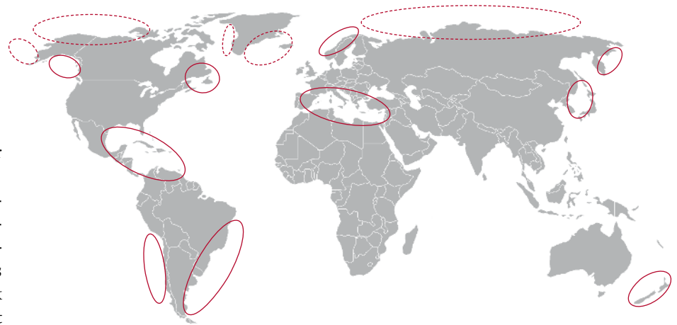
Abb. 2: Regionen weltweit mit günstigen Standortbedingungen (geeignete Mündungstypen) für Osmosekraftwerke.