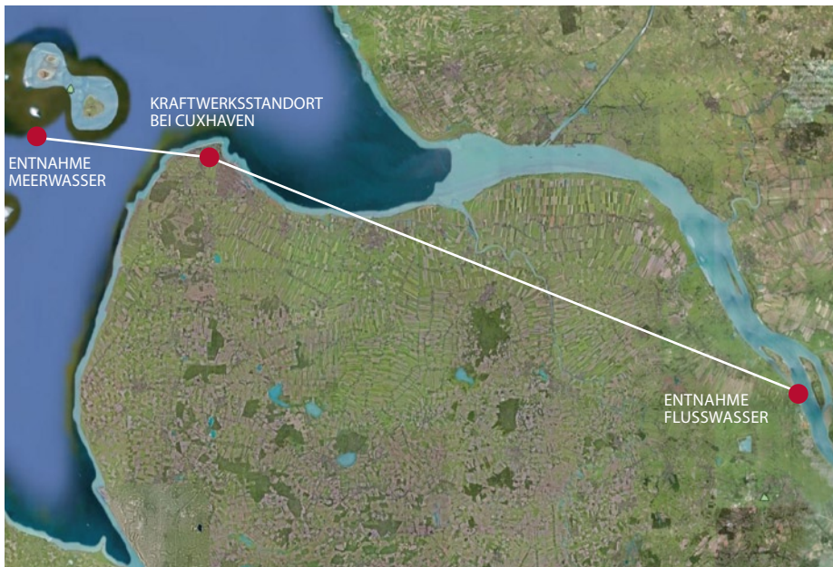
Abb. 3: Lange Rohrleitungen müssten ein Osmosekraftwerk an der Elbemündung mit den Wasserentnahmestellen verbinden.

weite Abflussmenge unserer Flüsse beträgt etwa 36 000 Kubikkilometer pro Jahr,“ gibt Stenzel an. Die daraus theoretisch zu gewinnenden Strommengen liegen mit fast 28 000 TWh in Höhe der heutigen Weltstromerzeugung (Tab. 1). Leider kann davon aber letztlich nur ein Bruchteil genutzt werden.