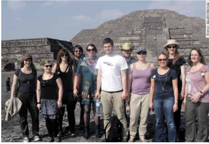
Die Gruppe vor den Pyramiden von Teotihuacan

Seit Anfang 2011 untersucht die Forschungsgruppe in einem DFG-Projekt die Mobilität des Personals großer Unternehmen zwischen Deutschland und Mexiko. Dabei interessiert sie auch der Einfluss, den die Verschiedenheiten der jeweiligen Organisationsstrukturen, Kulturen und Institutionen auf solche interkulturelle Austausche haben. „Oft scheitert der internationale Aus-