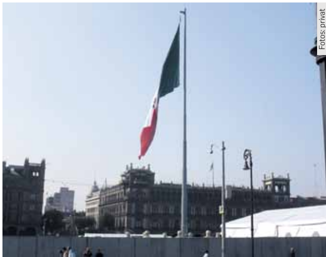
Mitten in Mexiko City