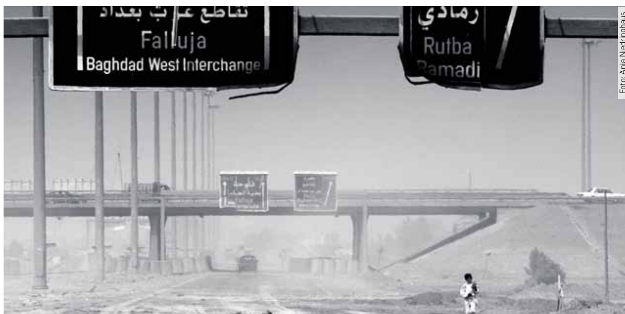
Was der Krieg übrig ließ: Falludscha/Irak, aufgenommen im April 2004