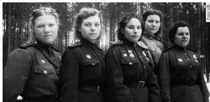
Kampf fürs Vaterland: 5 russische Soldatinnen der Roten Armee

Zu guter Letzt ein kurzer Hinweis auf einen Dauerbrenner: Es bleiben noch knapp zwei Wochen Zeit (bis 12. Februar), die Ausstellung „Menschenhandel in Birbuthsnepp und andere Alltagssorgen. Mittelalterliche Urkunden aus dem Kloster Flaesheim an der Lippe“ in den Kunstsammlungen der RUB zu besuchen. Das ist die Präsentation eines Projektes am Seminar für Klassische Philologie, das sich mit Urkunden des 13. Jahrhunderts aus einem ehemaligen Kloster beschäftigte; geöffnet: Di-Fr 11-17, Sa/So 11-18 h; Eintritt frei; www.rub.de/kusa .