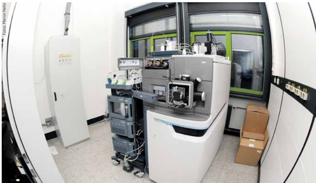
Hilfe auf der Suche nach neuen Antibiotika: Das frisch angeschaffte Massenspektrometer in der Bio-Fakultät erlaubt ganz neue Arten von Analysen.

Mit einem neuen Massenspektrometer suchen RUB-Biologen nach wirksamen Medikamenten