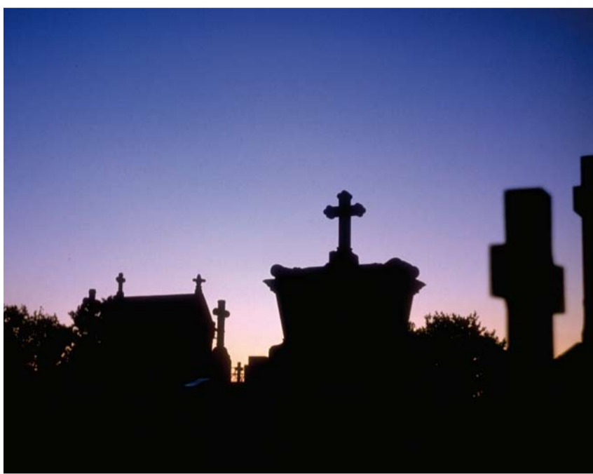
Der Tod ist prinzipiell unvorstellbar.

Seit einigen Jahren wird jedoch eine Revision dieser kulturkritischen Diagnosen geradezu erzwungen. Die Toten sind zurückgekehrt, nicht nur als Thema spiritueller, psychologischer oder philosophischer Diskurse, sondern in konkreter, sinnlicher, materieller Gestalt. Diese Rückkehr ereignet sich in den Künsten, in Literatur, Fotografien, Raum-Installationen und Ausstellungen; sie ereignet sich in Filmen und TV-Serien (wie „Six Feet Under“, „CSI“ oder „Crossing Jordan“), die das Publikum in allen forensischen Details über die konkrete Materialität der Toten aufklären; sichtbar wird sie auch in neu gestalteten Bestattungspraktiken oder in den öffentlichen Debatten um Sterbehilfe, Hospizbewegung, Transplantationsmedizin oder das biotechnologische Versprechen der Langlebigkeit – wenn nicht gar „Unsterblichkeit“.