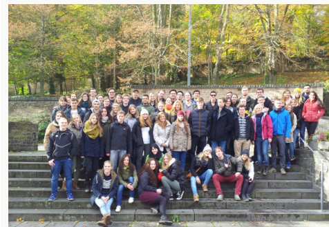
Die neuen Medizin-Studenten auf „Ersti-Fahrt“ in Maria Laach