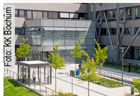
Am Knappschaftskrankenhaus in Bochum-Langendreer wurde nach mehrjährigen Bauarbeiten die neue Eingangshalle fertig gestellt. In dem Bauvorhaben, das insgesamt 16 Mio. € umfasste, wurden auch die Der neue Eingang am Knapp -Abteilung für Physiotherapie, die Patientenschlafklinik in Langen -aufnahme, eine Spezialambulanz und die interdisziplinäre Notaufnahme modernisiert.

Er forscht an der medizinischen Fakultät unter anderem zur Muskelphysiologie und zum größten Protein im menschlichen Körper, dem Titin.