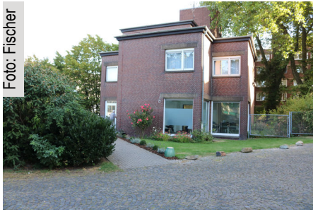
das Gebäude des Walk-In-Ruhr am St. Elisabeth-Hospital