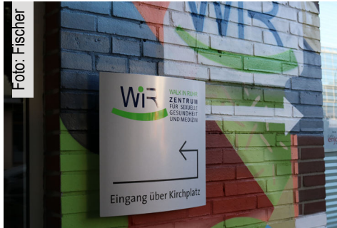
Wegweiser auf der Große-Beck-Straße

bereits aus der früheren Zusammenarbeit. „Unsere Vorstellung war, wir müssen uns anders aufstellen, wir müssen neue Strukturen schaffen und wir müssen eine neue Herangehensweise an diesen