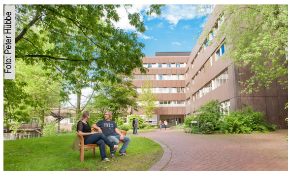
Das Krankenhaus Lübbecke-Rhaden