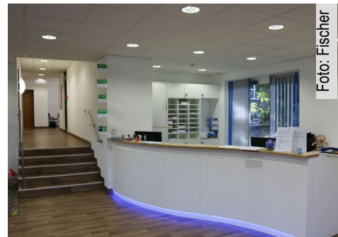
Die Ambulanz ist hell und freundlich gestaltet

dung ist deutschlandweit einzigartig und wird von allen Seiten gut aufgenommen. „Bei den Menschen, die wir erreichen wollen - was ja zunächst mal das wichtigste ist - ist die Resonanz sehr gut. Das ist sie aber auch sehr gut bei Kollegen, die das WIR gesehen haben und bereits mit uns zusammenarbeiten. Auch von der Politik wird das WIR durchaus als ein Modellprojekt für ganz Deutschland betrachtet.“ So lässt das Bundesministerium für Ge-