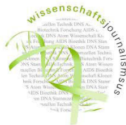
das Logo des Lehrstuhls Wissenschaftsjournalismus

Im Wintersemester gibt es von den beiden Lehrstühlen