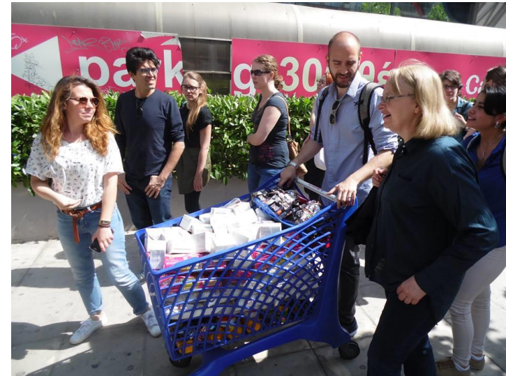
Großeinkauf für die Obdachlosen – RUB Europadialog aktiv