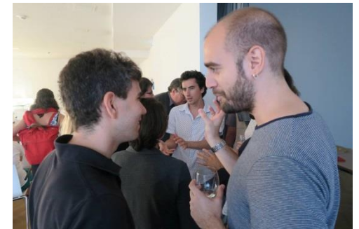
Länderabende „Grexit, Brexit, Euro-Exit?“ und „Blicke von der Ersatzbank“