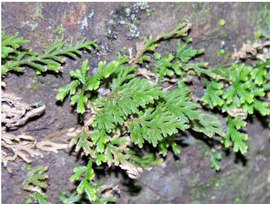
図1 シダ植物小葉類イヌカタヒバの自生写真（沖縄県西表島）

シダ植物・コケ植物は作物などの被子植物の持っていないたくさんの有用な性質を持っています。例えば、乾燥耐性能力や再生能力、耐病虫害性は被子植物よりもずっと優れています。今回の研究で遺伝子のリストができたことから、今後、これらの働きを司る遺伝子を解析することが容易になります。将来的には、作物に有用な性質を付与し品種改良することに役立つものと期待されます。