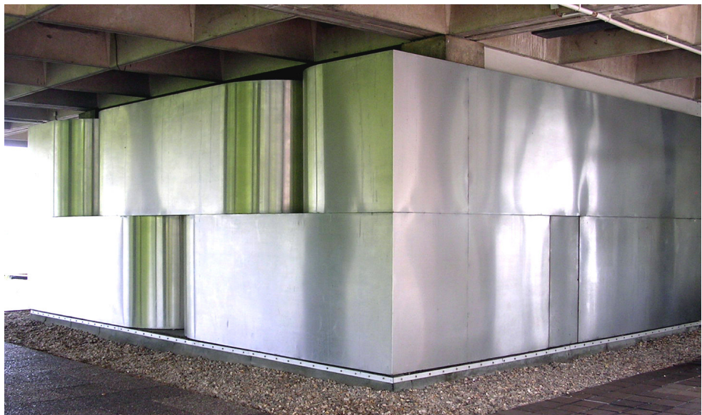
Gestaltung des Versorgungskerns NA-Nord von Erwin Heerich

stabverstoß“ und passe „nicht in den Rahmen der Architektur“. Desweiteren wurden die Entwürfe Gerstners und Knubels wegen einer möglichen Fehldeutung ihrer ideologischen Aussage nicht zur Ausführung empfohlen. Lediglich Manders hätte „mit wenig